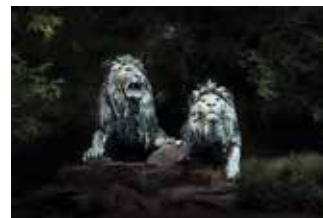
TIERPARK Berlino, agosto 2016